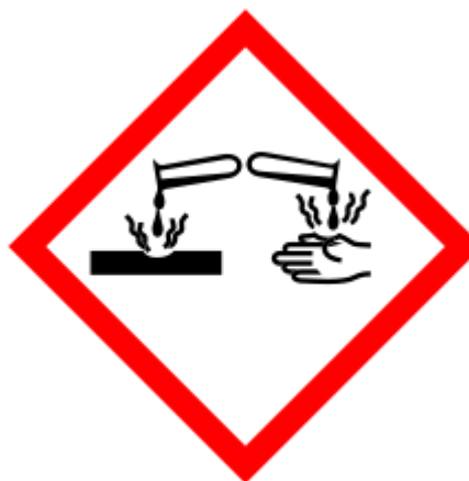
Pictograma de peligro

La sobreexposición puede causar debilidad y fatiga muscular.